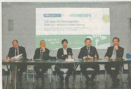
L'incontro del Rotary Rovereto Vallagarina sul Trans Adriatic Pipeline