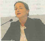
Il racconto Daria de Pretis

TRENTO «Una legge attesa». È il commento di Daria de Pretis, giudice della Corte costituzionale, sulle unioni civili. Di più non si sbilancia, «da giudice rinunci al tuo sentire personale e non sei autorizzata a esprimere opinioni, per garantire l'imparzialità». Però, aggiunge, «anche la Consulta con la sentenza 138 del 2010 si pronunciò sulle unioni civili, dicendo con forza che, se anche sono cosa diversa dal matrimonio, è obbligo del legislatore regolarle». Un impulso al Parlamento, dunque, ad approvare al più presto una legge in materia «Anche per dare attuazione all'articolo 2 della Costituzione, che garanti-