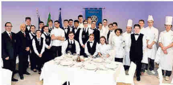
Gli studenti dell'Istituto Alberghiero che hanno preparato la cena per i Rotary