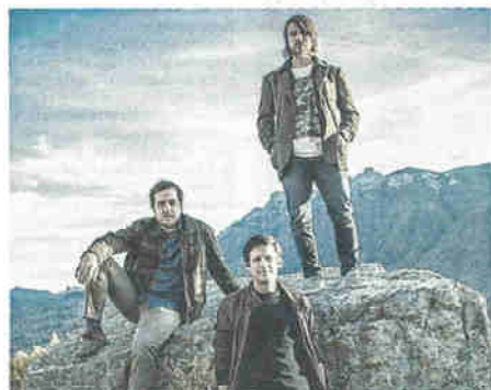
I Bastard Sons of Dioniso sabato saranno in concerto al Melotti